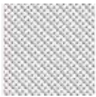
織物透聲幕布 增益：0.9 透孔面積：7%