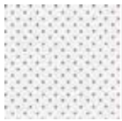
高清白幕 (透聲幕布) 增益：1.0 孔徑：0.5/0.8